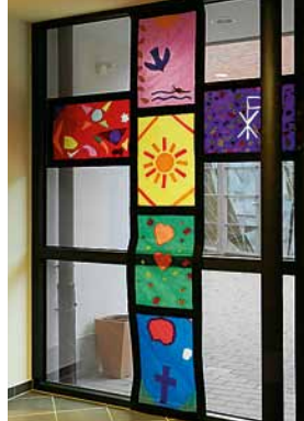
„Transparentkreuz“, entstanden auf der Konferfreizeit 2017

Höhepunkt, so ergab es das feed back, aber war für alle der gemeinsam vorbereitete besinnliche Abendmahls-gottesdienst in der wunderschönen Kapelle des ev. Jugendhofs Sachshain in Verden.