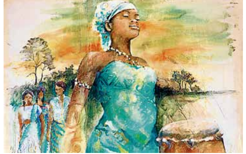
Abbildung: WGT e. V.