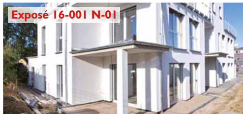
Exposé 16-001 N-01

Springe – barrierearme Neubau-ETW, EG Bahnhofsnahe Lage, moderne Architektur, wärme- gedämmte Bauweise (EnEV 2016), 92,48 m 2 Wohnfläche, 3 Zimmer, offene Küche, Gäste-WC, Aufzug, Terrasse, Fußbodenheizung, Kaufpreis: 213.000 Euro